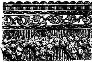
Frange (xviii e s.).