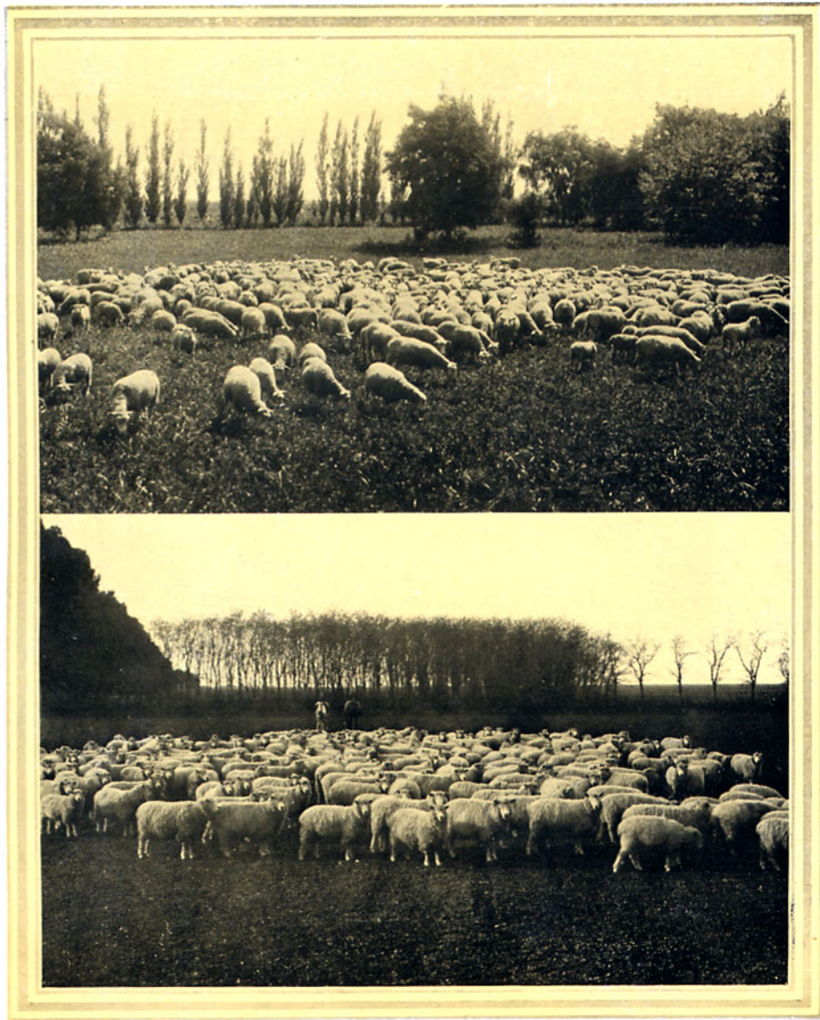
1. "LINCOLNS," RECIÉN ESQUILADOS.