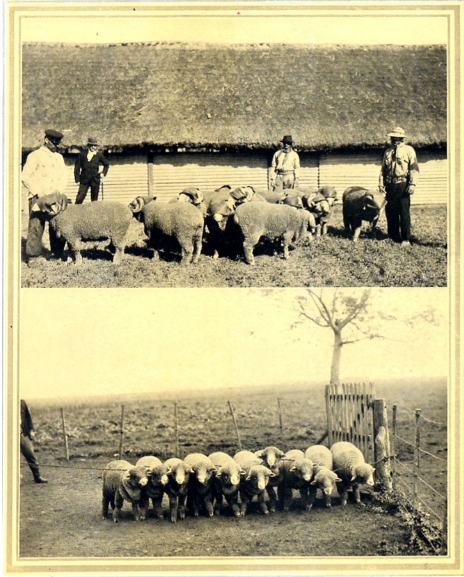
1. CARNEEROS, MERINA ARGENTINA RAMBOUILLET. 2. BORREGOS, MERINA ARGENTINA RAMBOUILLET.